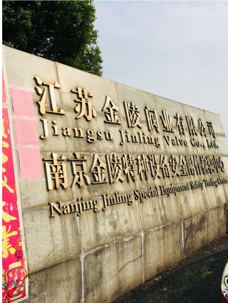
图 3-4 现场张贴照片