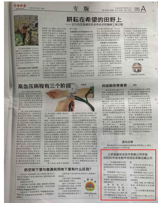
图 3-3 今日六合 5 月 25 日版照片